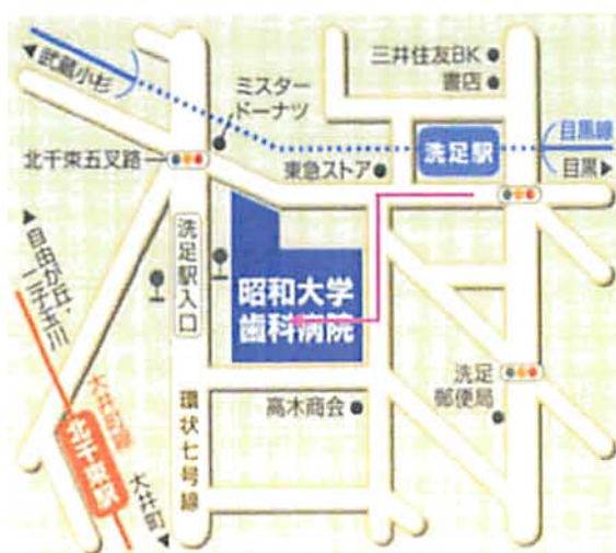
洗足駅からのご案内図